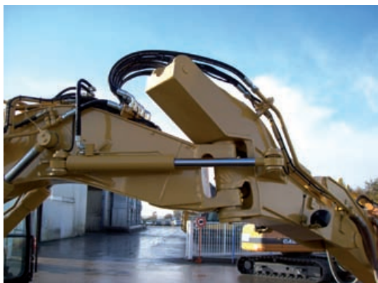
Vérin de déport de flèche

Chabas & Besson vous propose également des améliorations pour une meilleure fonctionnalité et une plus grande fiabilité.