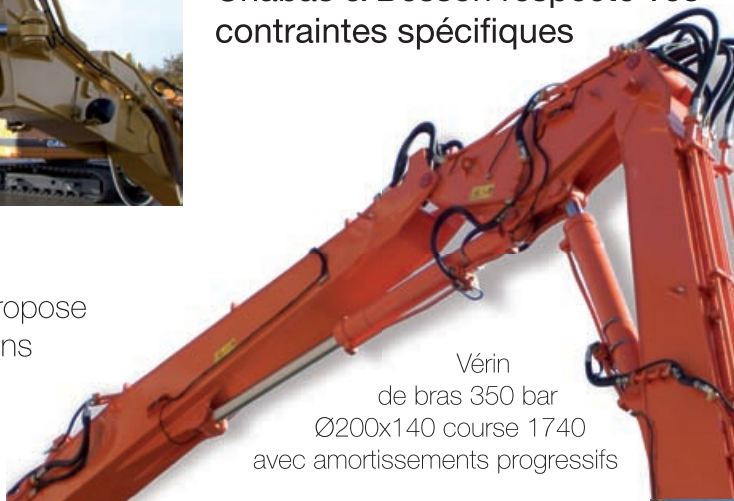
Vérin de bras 350 bar Ø200x140 course 1740 avec amortissements progressifs