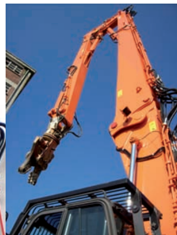
Équipement long de démolition

Chabas & Besson respecte vos contraintes spécifiques