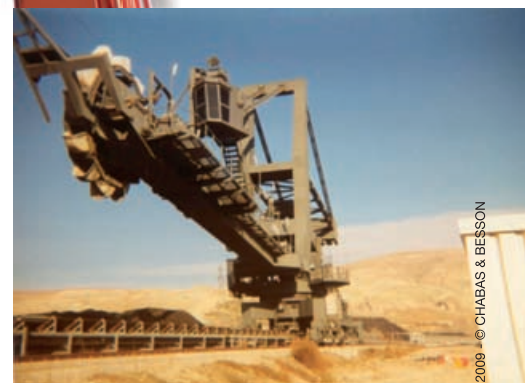
Auto-vérin de relevage de flèche et de tension de bande