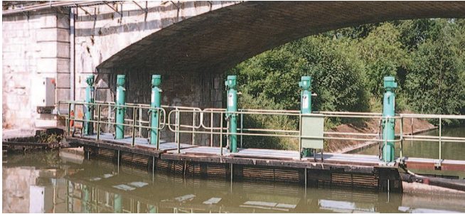
Commande de vannes hydrauliques (France)