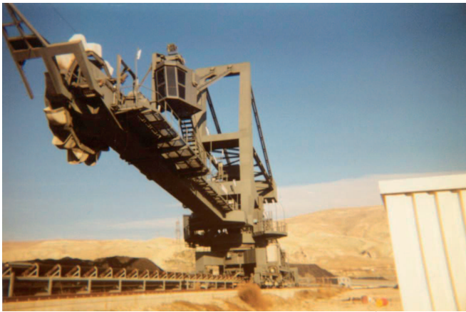
Relevage de flèche et de tension de bande (Étranger)