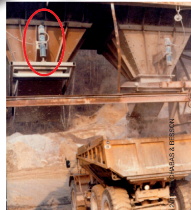
Commande de casque de trémie (Étranger)